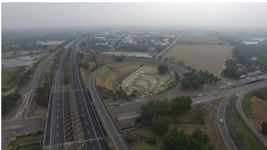
水綠花園空拍實景